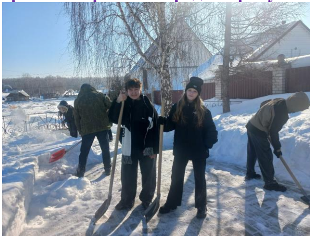
Поработали на славу!

учителем ОБЗР в рамках акции «Дорога к обелиску» привели в порядок Памятник воинам Великой Отечественной войны в селе Мохнатушка Центрального района города Барнаула.