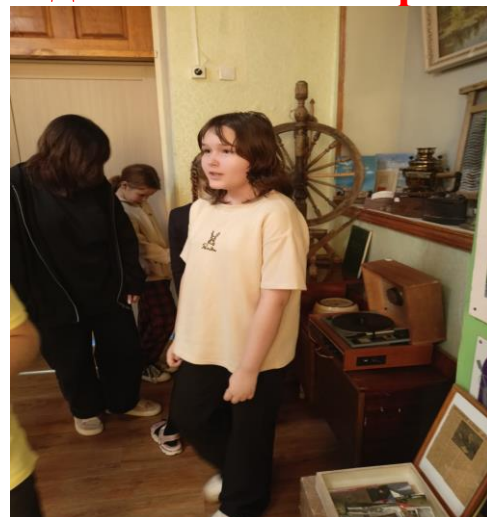
Редколлегия газеты «Архивариус»