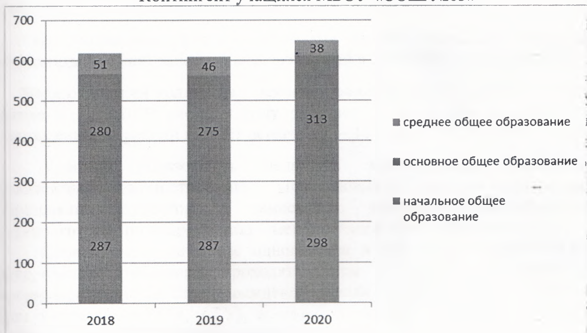
Контингент учащихся МБОУ «СОШ №63»

МБОУ «СОШ №63» находится в микрорайоне р.п. Южный, где расположены социальные и культурные объекты, такие как КГБУЗ «Городская больница № 10», ДК поселка Южный, Библиотека №10 имени А.С. Пушкина, Детская спортивная школа «Рубин», ЦДТ №2, Городская школа искусств №4. В микрорайоне школы ведется застройка частного сектора, что приводит к увеличению контингента учащихся.